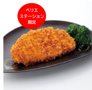
とんかつ和幸（検見川浜） 千葉県産 元気豚 ロースかつ（お惣菜） 980円（税込）