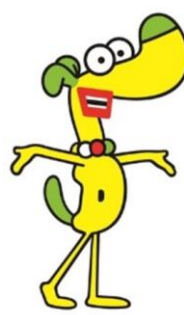
館山市 マスコットキャラクター