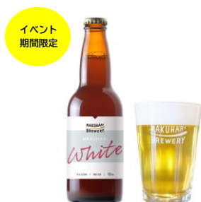
カフェフォンス（海浜幕張） 期間限定 幕張ブルワリー WHITE ALE 600円（税込）