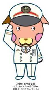
千葉県日本千葉支社 マスコットキャラクター 朝顔犬（あさぎょうけん）