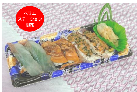
すし銚子丸テイクアウト専門店（海浜幕張） ご当地3種握りセット 950円（税込）