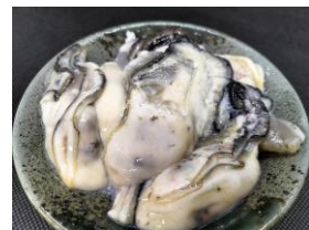
《宮古市産 牡蠣のむき身》