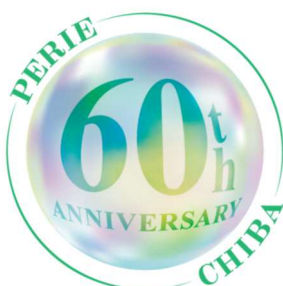
▲開業 60 周年記念 ロゴマーク