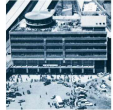
▲ペリエ千葉の前身となる「千葉ステーションビル」開業時の様子