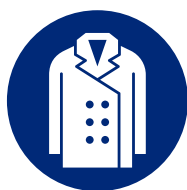
ジャケット・コート